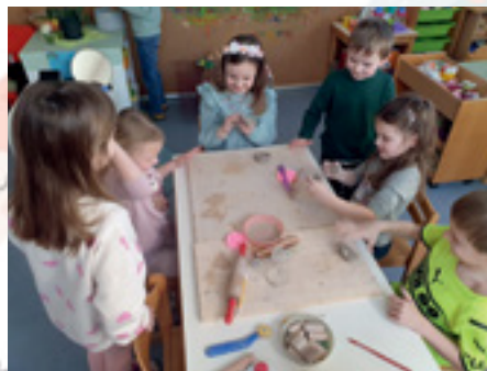
Arbeiten mit Ton