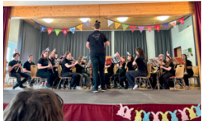
Osterkonzert Tonados und Tonadinos 2025