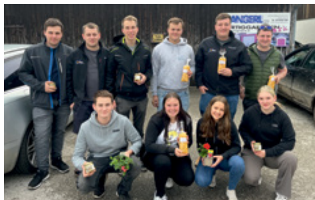
Bericht: Bianca Lovecek

Zu Ostern durften sich die über 80-jährigen Weißkirchner*innen wieder über eine kleine Aufmerksamkeit freuen. Der diesjährige Frühlingsgruß waren ein Blumenstock sowie ein Gläschen regionaler Honig oder Nudeln. Die Aktion wurde mit viel Herz von engagierten Helfer*innen organisiert, die damit ein Lächeln auf viele Gesichter zaubern konnten. Die Freude und Dankbarkeit der Beschenkten berührte zutiefst und zeigte einmal mehr, wie viel kleine Gesten bedeuten können.