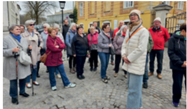
Erster Ausflug nach Steyr mit sehr informativer Stadtführung

Wir sind mit allen unseren Aktivitäten in das Frühjahr gestartet. Unser erster Ausflug führte uns nach Steyr mit einer sehr informativen Stadtführung und Abschluss beim Mostheuerigen Kuglbauer. Eine Gruppe war mit den Seniorenreisen beim Frühjahrestreffen im Seebad Albena – der Perle an Bulgariens Schwarzmeerküste.