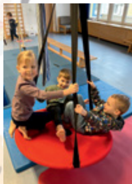
Im Bewegungsraum gibt es viele Angebote