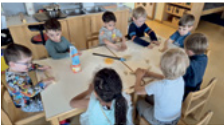
Backen für das Osterfest

Kinder in ihrer Entwicklung unterstützen wollen. Die Freude am gemeinsamen Tun steht dabei immer im Vordergrund. In den Kindergruppen finden daher laufend Aktivitäten statt, die die Kinder anregen mitzumachen und gemeinsam aktiv zu werden.