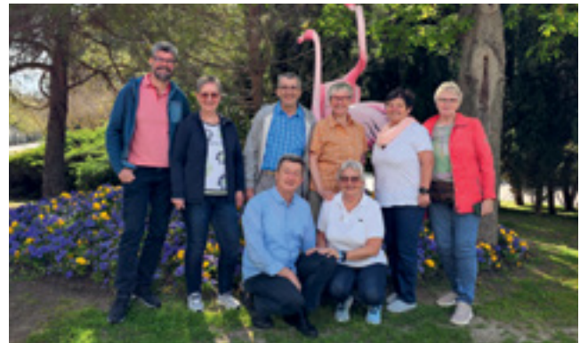
Frühjahrestreffen des PVÖ in Bulgarien

Mit einer Gruppe von 15 Personen beteiligten wir uns gemeinsam mit dem LSC DELTA Fitness Marchtrenk am Wings for Life World Run, ein seit 2014 in 33 Ländern weltweit stattfindender Wohltätigkeitslauf, dessen Einnahmen zu 100 % der Rückenmarkforschung zugutekommen.