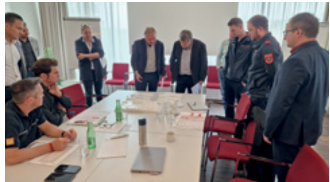
Die Jury bei der Begutachtung und anschließender Bewertung der eingereichten Projekte

im Kostenrahmen bleiben zu können, wurden die Rahmenbedingungen für einen Neubau festgelegt und ein Architektenwettbewerb durchgeführt. Dieser Wettbewerb endete Ende April 2025 mit der Abgabe von Plänen und Modellen der teilnehmenden Architekten.