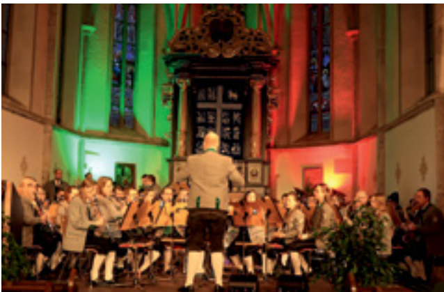
Kirchenkonzert 2025 in der Pfarrkirche Weißkirchen

Unsere musikalische Bandbreite ist ebenso vielfältig wie unser Verein. Von traditioneller Blasmusik über zeitgenössische Arrangements bis hin zu festlichen Beiträgen bei kirchlichen Anlässen ist alles dabei. Gerade die Mitwirkung bei Gottesdiensten, Prozessionen und besonderen Lebensereignissen liegt uns am Herzen. Doch auch abseits der Kirchenmauern sind wir klangvoll unterwegs: Ob bei Gemeindeveranstaltungen, Konzerten oder Jubiläen – der Musikverein Weißkirchen ist ein fester Bestandteil des öffentlichen Lebens und bringt dabei Tradition und Gegenwart in Einklang.