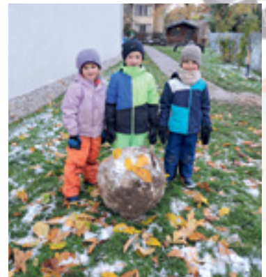
Im Garten finden wir immer interessante Dinge