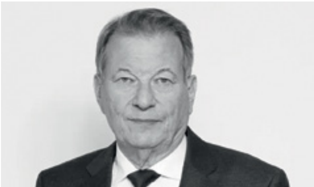
Peter Kostelka - ein Vorsitzender mit großer Empathie, Respekt und Einfühlungsvermögen

Peter Kostelka, der seit 2018 an der Spitze des Pensionistenverbandes Österreichs stand, war die starke Stimme der älteren Generation in diesem Land. Mit unermüdlichem Einsatz, ganzer Kraft und stets aus tiefster Überzeugung vertrat er die Interessen der Pensionistinnen und Pensionisten mit Stärke, aber ebenso mit großer Empathie, Respekt und Einfühlungsvermögen. Im Pensionistenverband wird Peter Kostelka stets unvergessen bleiben. Unsere Gedanken sind bei seiner Familie, der unser tiefstes Mitgefühl gilt.