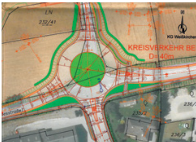
Baubeginn für den neuen Kreisverkehr ist Ende Mai 2025

Laut Mitteilung der Landesstraßenverwaltung wird in der letzten Maiwoche 2025 mit dem Bau des neuen Kreisverkehrs an der Kreuzung Traunufer-Landesstraße/Biedermeierstraße/Obere Dorfstraße (siehe Bild) begonnen. Dieser Kreisverkehr wird die Sicherheit der Verkehrsteilnehmer entsprechend erhöhen, zumal er sichere Querungshilfen für Fußgänger bieten und auch die Geschwindigkeiten der Fahrzeuge reduzieren wird.