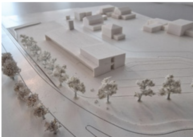
Das Siegermodell der Architekten Schneider Lengauer Püh- ringer Architekten ZT GmbH

Nach Vorliegen der Gesamtkostenschätzung wird mit dem Land OÖ die Finanzierung verhandelt. Baubeginn soll im März/April 2026 sein.