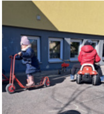
Wir sind bei jedem Wetter gerne draußen