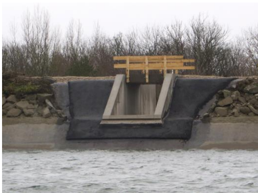
Symbolfoto: Errichtung des Einlaufbauwerks bei abgesenktem Staupiegel